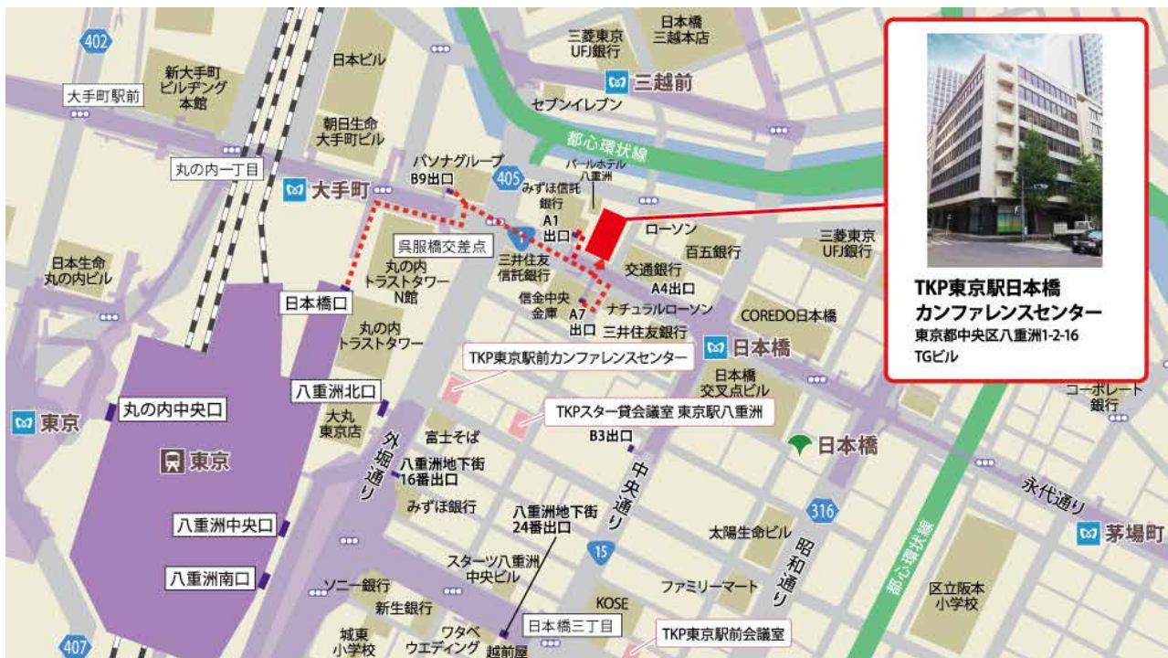
TKP東京駅日本橋 カンファレンスセンター 東京都中央区八重洲1-2-16 TGビル