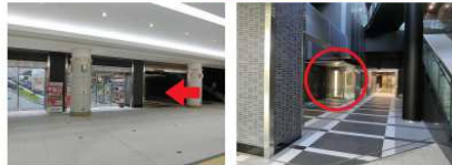
←の方向に進み ○の自動ドアへ