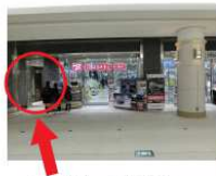
ここに入って左手にエレベーターがあります