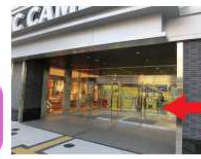
自動ドアを入れて右手にエレベーターがあります