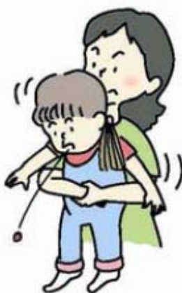
図 3 ハイムリッヒ法 (年長児)

大人や年長児では、後ろから両腕を回し、みぞおちの下で片方の手を握り拳にして、腹部を上方へ圧迫します (図 3)。この方法が行えない場合、横向きに寝かせて、または、座って前かがみにして背部叩打法を試みます。