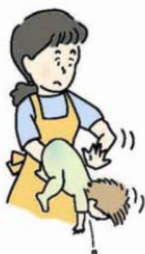
図 1 背部叩打法 (乳児)

乳幼児では、口の中に指を入れずに、乳児は片腕にうつ伏せに乗せ顔を支えて (図 1)、また、少し大きい子は立て膝で太ももがうつ伏せにした子のみぞおちを圧迫するようにして (図 2)、どちらも頭を低くして、背中の中を平手で何度も連続して叩きます。なお、腹部臓器を傷付けないよう力を加減します。